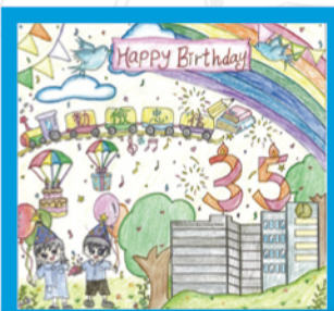
季軍 樂善堂梁泳釗幼稚園 WK2C 吳晞榆