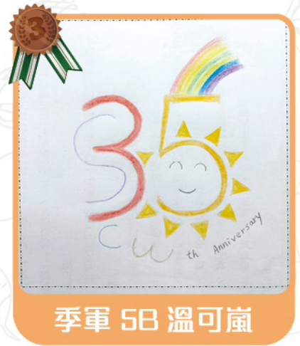
季軍 5B 溫可嵐