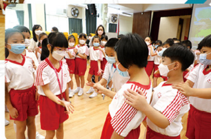
◆正向遊戲—猜拳歌活動，從遊戲中逐步建立關係。