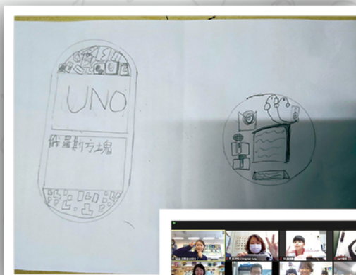
◆設計團隊帶領學生 進行空間設計工作坊