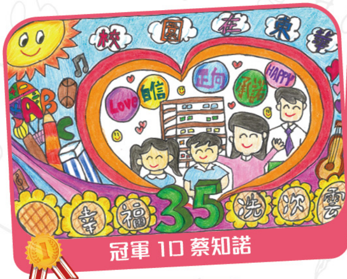
冠軍 10 蔡知諾

我們將得獎者的畫作，配上藍天綠地的背景，創作了一幅長22米的壁畫，為三樓視藝室門外的走廊換上新裝，讓人感覺清新！