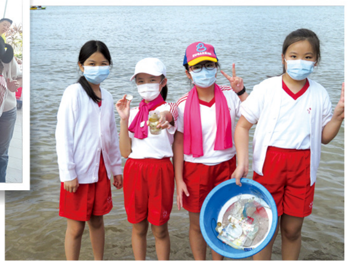
◆組織環保大使，參與環保活動及在校內協助實踐廢紙重用及回收。