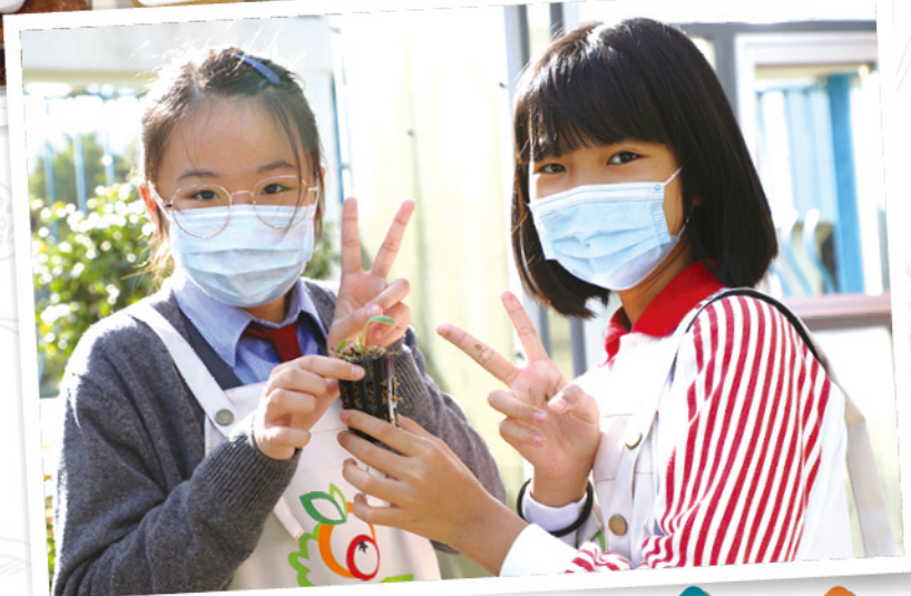
◆全校學生參與「一人一花」活動。

學校鼓勵師生及家長參與園藝活動，接觸自然大地，感受植物的生命能量，產生愉悅的心情，療癒和撫慰人的心靈，也增進身心靈健康。透過視覺接收自然景觀後，可以增加正面想法或緩和負向情緒，進而重獲生理機能的平衡。