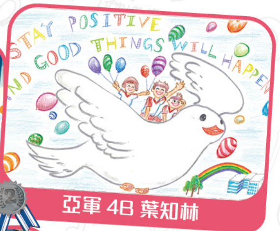
亞軍 4B 葉知林