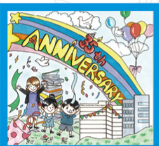
亞軍 耀榮中英文幼稚園 K3B 伍詠彤