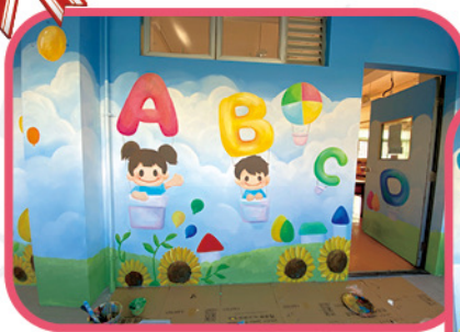
◆孩子們充滿正能量的快樂笑臉