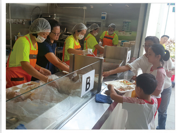
◆實踐健康飲食在校園，學校設立「綠色廚房」，實施現場分飯，推動「惜食」文化、減少廚餘，以及減少使用即棄飯盒。