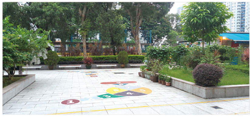
◆校園廣植花木，鳥語花香，令師生及家長能沉浸在舒適的環境中。