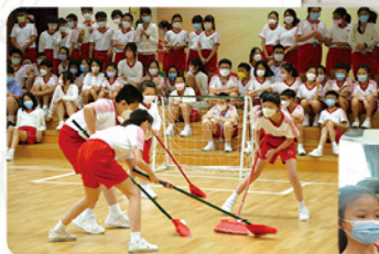
◆掃把球比賽有效建立團隊精神