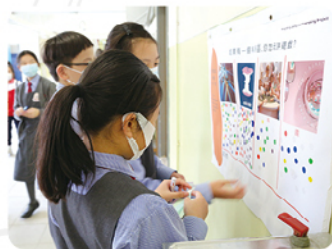
◆全校學生進行投票， 揀選喜愛的设计