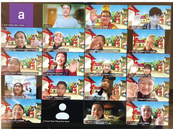
◆ Students are having a rehearsal before the performance.

The drama team in our school has long been consistently promoting English learning through arts and providing students with a myriad of opportunities to showcase their talents and unleash their potentials. During the drama practices, students from different forms cooperate together to develop the script, prepare props and arrange the lighting and sound effects. It is hoped that students could enhance their self-confidence, develop their communication skills and cultivate their interest in drama through a variety of authentic learning experiences.