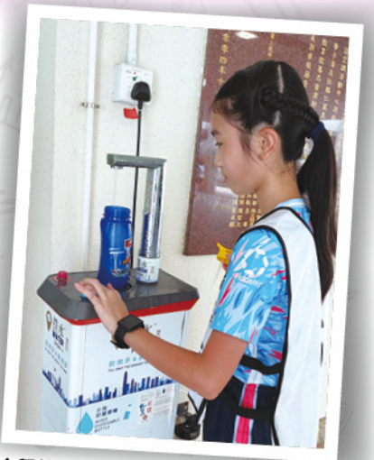
◆學校提供水機，讓學生養成自攜水樽的習慣，減少購買瓶裝水。