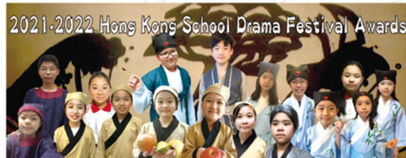
◆ Students' efforts paid off. They are happy with the awards.

In addition to the awards, it is more important that students could acquire drama skills and stretch their potentials to the fullest through a great variety of fun and enjoyable learning experiences.