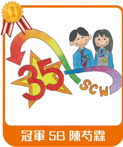
冠軍 5B 陳芍霖