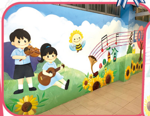
◆壁畫配上藍天綠地的背景，感覺清新