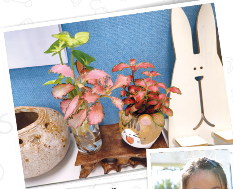
◆在繁忙的工作中，案頭的小盆栽有助舒緩緊張的情緒。

學校鼓勵師生及家長參與園藝活動，接觸自然大地，感受植物的生命能量，產生愉悅的心情，療癒和撫慰人的心靈，也增進身心靈健康。透過視覺接收自然景觀後，可以增加正面想法或緩和負向情緒，進而重獲生理機能的平衡。