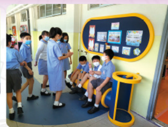
◆同學最愛的閒聊地點