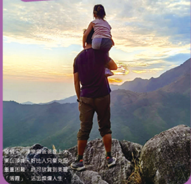
冠軍及最受歡迎獎 3A 蘇津樂

疫情下，津樂與爸爸登上大東山頂峰，好比人只要克服重重困難，終可欣賞到美麗「落霞」，活出燦爛人生。