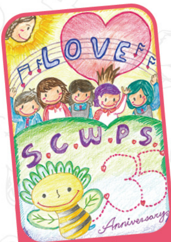
季軍 5D 黃巧淳