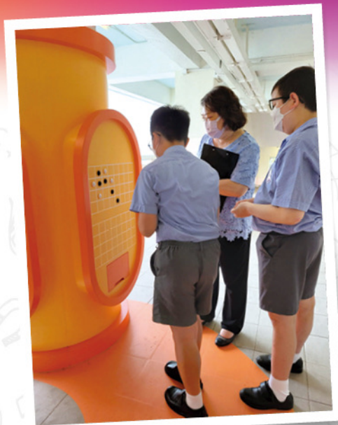
◆原來校長也喜歡下棋