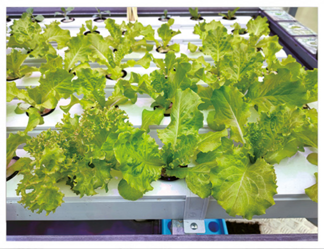
◆在學校園圃建立「綠色課室」，讓學生透過水耕種植和管理農圃，學會親近、欣賞和愛護大自然，培養關心及愛護環境，實踐綠色生活。通過與同學、家長和社區人士分享種植成果、經驗和心得，將環保意識推廣至社區。