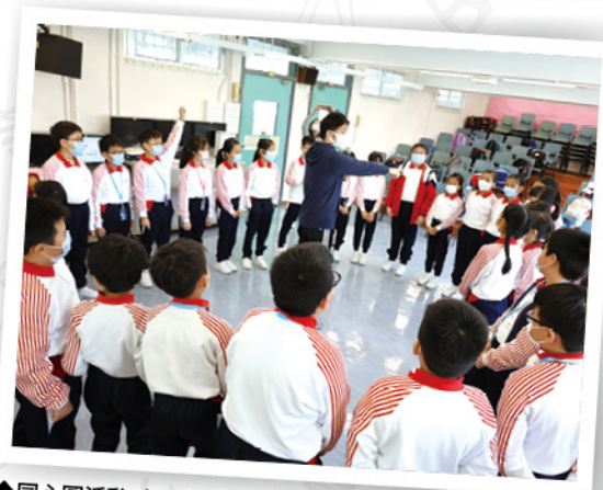
◆同心圓活動-有助學生了解自己及他人的性格特質。

本校着重發展學生身心靈健康，使學生認識及表達自己的情緒，建立個人正向情緒；讓學生明白及掌握與人相處的技巧，發展正向人際關係；發掘個人性格強項，在學校及社群中，發現個人所長，盡情發揮，全情投入，努力不懈，達致人生目標，逐步邁向幸福。