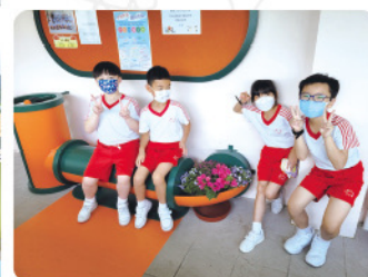
◆樓層間新添的植物，由植物小管家負責照顧。