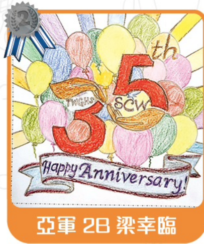
亞軍 2B 梁幸臨