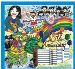
冠軍 東華三院馬陳景霞幼稚園 K3D 姚景彰

學校舉辦了35周年校慶幼稚園親子填色及創作比賽，讓沙田區幼稚園的學生和家長與我們一同慶賀35周年校慶。我們一共收到129份作品，作品中感受到校慶歡愉快樂的氣氛外，更看到大家非凡的創意。大家也來欣賞得獎的作品！